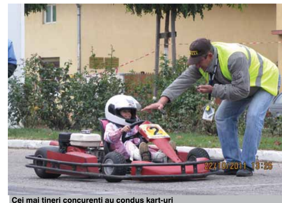
Cei mai tineri concurenți au condus kart-uri