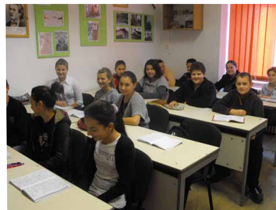
elevii clasei a VII-a A de la Școala cu clasele I-VIII nr. 1