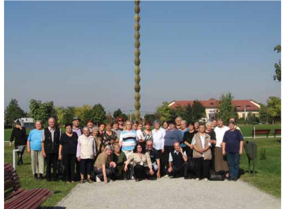
Pensionarilor „Seniorii Sănniclauseni” mici sume de bani.

Pentru a nu mai fi discutiți între pensionari privind pretul excursiei și traseele stabilite, va anunțam ca aceste excursii se organizează doar prin intermediul Asociației de Pensionari